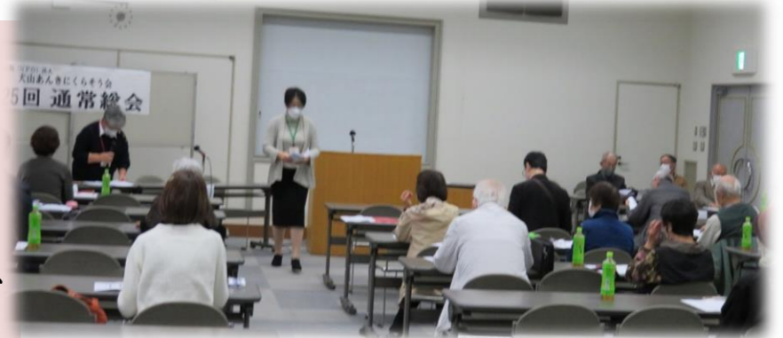
ご参加いただきありがとうございました