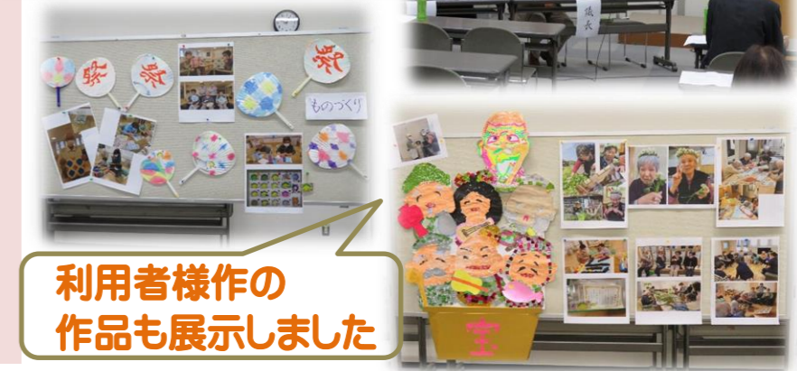
利用者様作の作品も展示しました