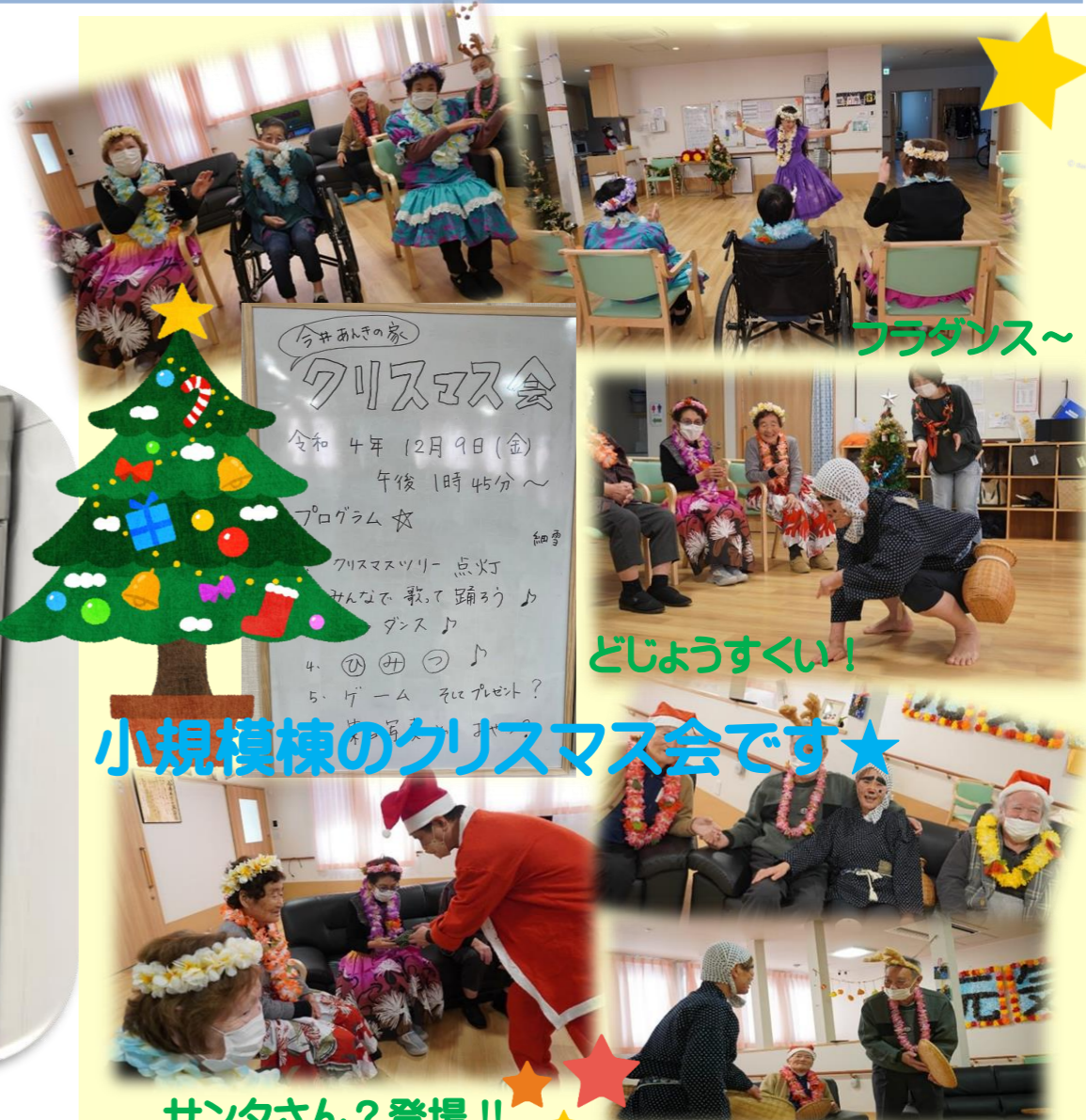
小規模棟のクリスマス会です★