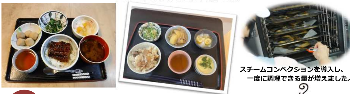
スチームコンベクションを導入し、一度に調理できる量が増えました。

塔野地に移転して丸2年が経ちました。街中に移転し配達できるエリアが広がった事もあり、配食サービスのご利用が増えています。新施設の厨房は100名分の食事を作ることができます。あんきの家には7名の厨房スタッフがあり、毎日手作りの温かい食事をお届けしています。