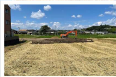
8/25から農地の埋め立て工事を開始しました

寄付金・貸付金ともにまだ受付しております。ご検討のほど、どうぞよろしく願いいたします。工事に係る借入金については令和4年3月までの受付とさせていただきます。寄付金は随時受付しております。