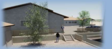
西側駐車場から見た移転先施設

寄付金 32人の会員の方々からいただきました。 総額 2,817,000円 貸付金 22人の会員の方々からお借りすることができました。 総額 15,800,000円